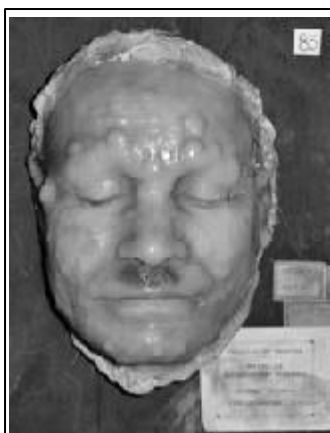
Foto 5. Lepra lepromatosa. Museo de Cera UniNacional. 2004

a otros órganos, conocimientos que posteriormente me servirían mucho en la vida profesional. En 1954 recibí el grado de Médico y Cirujano con mucha alegría por el logro, pero con la tristeza de no estar con muchos compañeros y amigos de curso que murieron durante los hechos luctuosos de la Ciudad Universitaria y la carrera séptima, que es mejor no recordar.