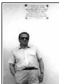
Foto 6. Placa de reconocimiento. Belén de Cerinza. 1957